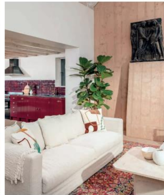
A nappali mögött kialakított konyha az újonnan emelt épületrészben található. A domináns vörös árnyalat merész, mégsem tolaakodó

A Quantock Hills nyugati szélén járunk, a szelíden hullámzó dombokon öreg tölgyerdők és gondozott mezőgazdasági földek váltják egymást. Anglia talán legharmonikusabb vidékét 1956-ban az országban elsőként jegyezték be kiemelkedő természeti szépségű területként. A rendkívül gazdag növény- és állatvilág, a kis falvak békés hangulata egykor számos irodalmi művet ihletett, többek között Samuel Taylor Coleridge és William Wordsworth, az angol romantikus költészet alapítóinak jó néhány írását. De a Quantock Hills a mai napig megőrizte varázsát.